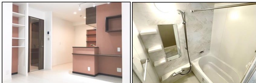
※写真は過去リノベーション事例です